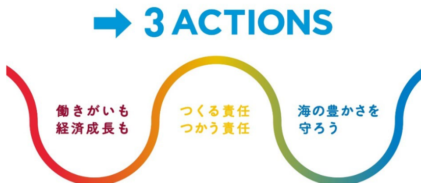
つなぐはぐくむツーリズムプロジェクト 三つの重点目標イメージ

「つなぐはぐくむツーリズム」では、SDGs の中で観光が主要テーマとされている、目標 8「働きがいも経済成長も」・目標 12「つくる責任つかう責任」・目標 14「海の豊かさを守ろう」の三つを重点目標に設定し、この目標の達成につながるアクションに触れる機会を提供します。