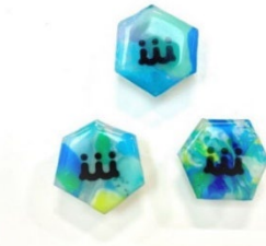
プロジェクトバッジ イメージ