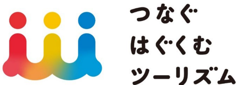
「つなぐはぐくむツーリズム」プロジェクトロゴ

「つなぐはぐくむツーリズム」は、当社直営の旅館・ホテル、研修施設全 22 施設を対象に、SDGs の中で特に観光が主要テーマとされている「働きがいも経済成長も」「つくる責任つかう責任」「海の豊かさを守ろう」の三つの目標の達成につながる体験を宿泊プランやお食事、展示などのさまざまな形で提供します。地域の観光や施設での滞在を通して、「サステナブルな観光」につながるアクションを楽しみながら体験していただきます。そこで得た“気づき”が、旅行が終わり日常に戻ってからも、普段の意識や行動に少しでも変化を与えられるようなインパクトのひとつへと育まれていくことを目指しています。