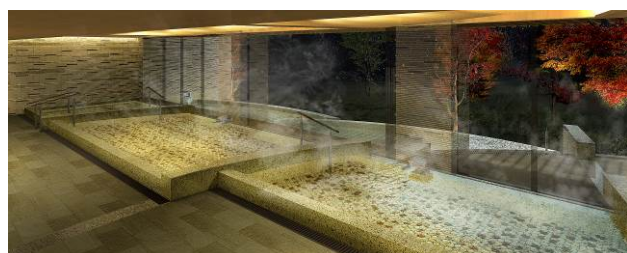
四季の露天風呂 棚湯 (庭園ビュー)