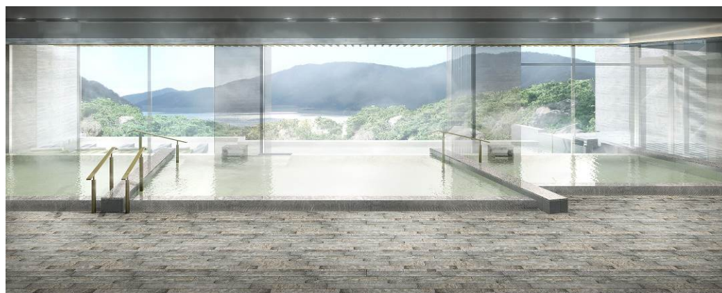
四季の露天風呂 棚湯 (芦ノ湖ビュー)