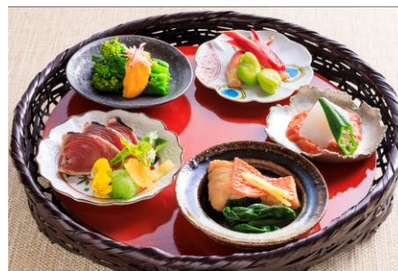
小籠に盛った料理