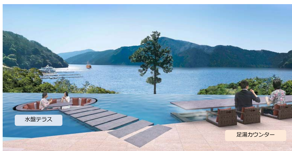
ロビーから続く水盤テラス、足湯カウンターから芦ノ湖を一望できます。

ロビーから続くオープンエアのパブリックスペースに、水盤テラスと足湯カウンターを設けました。森林の澄んだ空気、小鳥のさえずり、風の感触を楽しみながら、芦ノ湖の眺望を眼前にくつろぎのひとときをお過ごしいただけます。水盤テラスでは水を張った空間の中に円形のソファを設置し、芦ノ湖に浮かんでいるかのような感覚を楽しめます。足湯カウンターで、飲み物を手に心地よい湯のぬくもりに身をゆだねれば、身も心もリラックスできます。