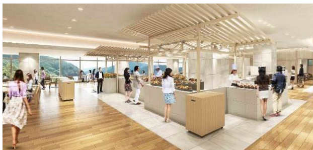
ブッフェレストラン「 とき 季しかり」

【 しかり しかり】 しかりは、自然の「然」をひらがなにしたもの。その土地の自然の恵みを生かした料理を提供すること、提供側の思いや、料理に納得していただき、「そのとおりだ＝然り」と感じていただく事を表現しています。