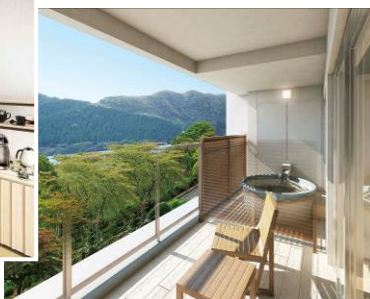
露天風呂付き和洋室 (露天風呂)