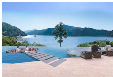
「箱根・芦ノ湖 はなをり」 ※イメージ 芦ノ湖を一望する水盤テラス、足湯カウンター

これまで培ったノウハウを結集して、このたび日本有数の温泉地である箱根にオリックスグループ初の新築旅館である『箱根・芦ノ湖 はなをり』を開業いたします。一から旅館の開発を行なうことで、お客さまのニーズやライフスタイルに合わせた施設の実現を目指します。ホテルのような快適さと和風旅館ならではのくつろぎ、心地よいおもてなしを提供する旅館がこの夏、誕生します。