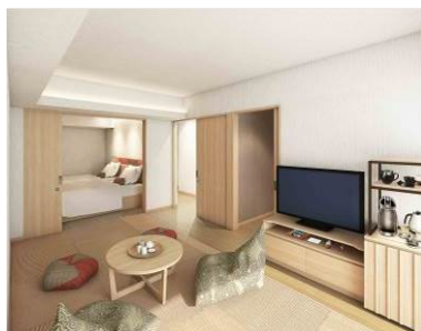
露天風呂付き和洋室 (客室)