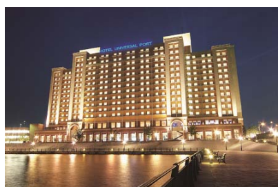
ホテル ユニバーサル ポート