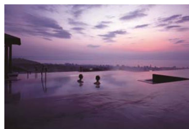
別府 杉乃井ホテル