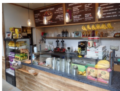
【SAMBAZON AÇAÍ CAFÉ】