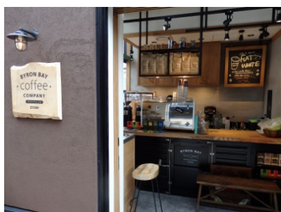
【BYRON BAY COFFEE】

オーストラリアスタイルの本格コーヒースタンド「BYRON BAY COFFEE」の国内初となる常設店舗、女性に人気のアサイーを手軽に楽しめる「SAMBAZON AÇAÍ CAFE」、大人の時間と空間がひろがる「HARAJUKU BAR」の3店舗のコラボレーションショップが誕生します。