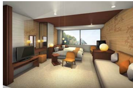
「ブライズルーム」イメージ

既存の和室を改装し、ブライズルーム2室を新設しました。婚礼当日の準備やお色直し時の控え室としての利用をはじめ、婚礼後には、新郎・新婦でゆっくりとご宿泊いただけます。