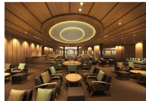
「ロビーラウンジ」イメージ

「Natural Basic」をコンセプトに改修したロビーラウンジは、木の暖みに癒され、誰もが落ち着き、ほっとする空間を提供します。