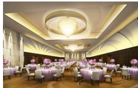
メインバンケットホール「鳳翔」イメージ

メインバンケットホールの名前の由来である「鳳凰」が飛び立つイメージをコンセプトに、「鳳凰」の羽をモチーフにした勢いが感じられるデザインを壁面とカーペットに採用しながらも、会津の伝統と格式を感じられる空間へと刷新。また、会津エリアで初の3Dプロジェクションマッピングなどの新照明・映像システムを導入し、バンケットルームの壁面に映像を投影することで、ダイナミックな動きのある演出が可能になりました。