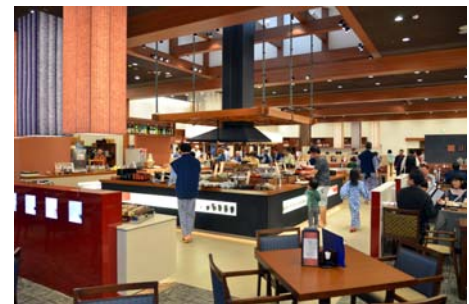
バイキングレストラン「あがらんしょ」