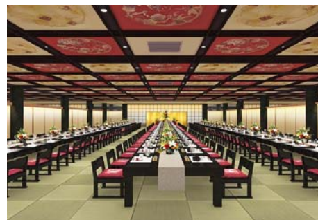
和式大宴会場「芙蓉」イメージ

「芙蓉」の花言葉である「繊細な美」「しとやかさ」を表現する色使いと、「芙蓉」の花を想起させる「親しみ・優雅さ・華やかさ」を表すデザインをあしらい、床面を総琉球畳に変更しました。ご宴会だけでなく、和婚にもご利用いただける趣ある空間に改装しました。