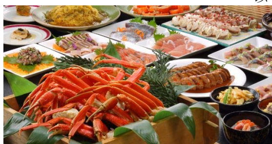
バイキングメニューイメージ

<報道関係者からのお問い合わせ先> オリックス不動産株式会社 運営統括部 永井・岡弘・石井 TEL : 03-5418-4313