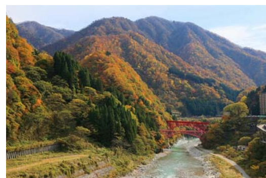
カフェラウンジ「樺-KEYAKI-」からの眺望