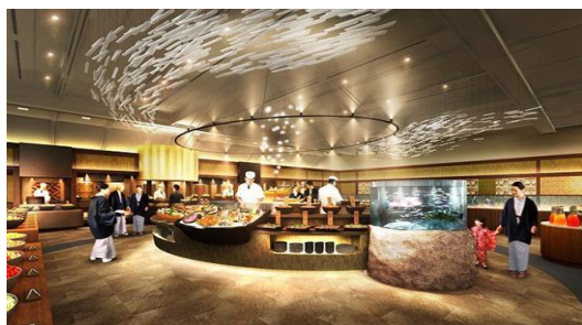
バイキングレストランイメージ