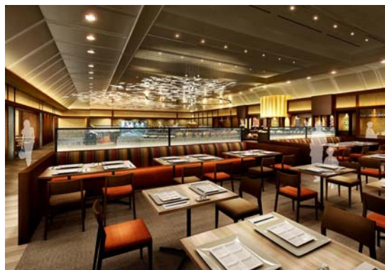
バイキングレストランイメージ