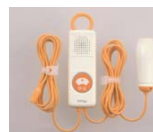
緊急呼出付ボタン(ベッドサイド)