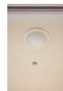
生活サイクルセンサー