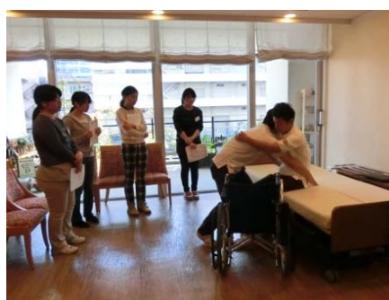
インターンシップ(介護体験)の様子