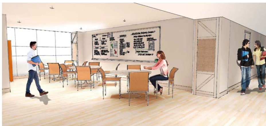
コミュニティーラウンジ(イメージ)