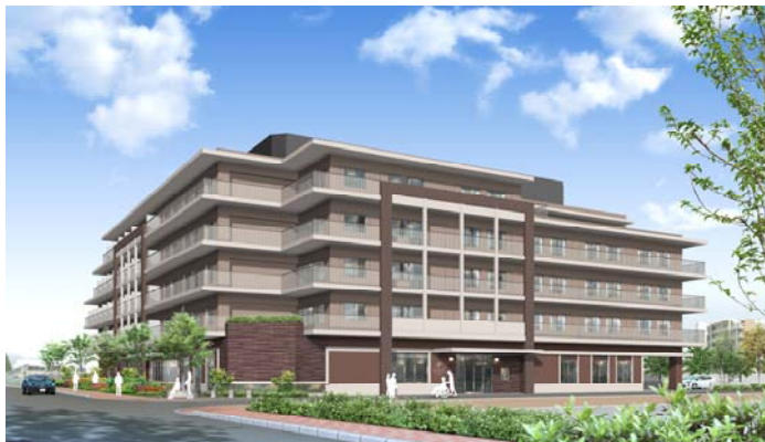
外観イメージ 土地・建物 : 賃借

開設時期 : 2015 年 3 月(予定) 管理会社 : 株式会社コープリビングサービス 居室面積 : 26.2m 2 総戸数 : 59 戸 主な設備 : 風呂、浴室乾燥機、トイレ、洗浄機付便座、独立洗面化粧台、室内洗濯機置き 場、IH 2 口コンロ、カラーモニター付インターホン、クローゼット、シューズケース 共用設備等 : オートロック、エレベーター、防犯モニター、防犯カメラ、自転車置き場、宅配ボ ックス、インターネット無料、防災備蓄倉庫完備、コミュニティーラウンジ