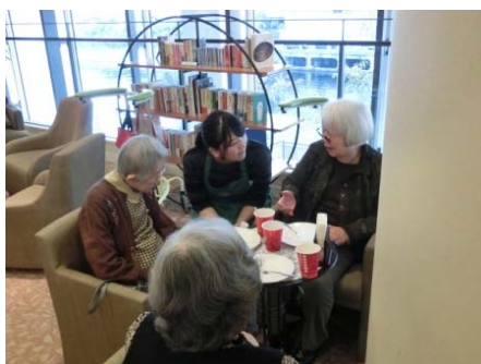
インターンシップ(アクティビティ補助)の様子