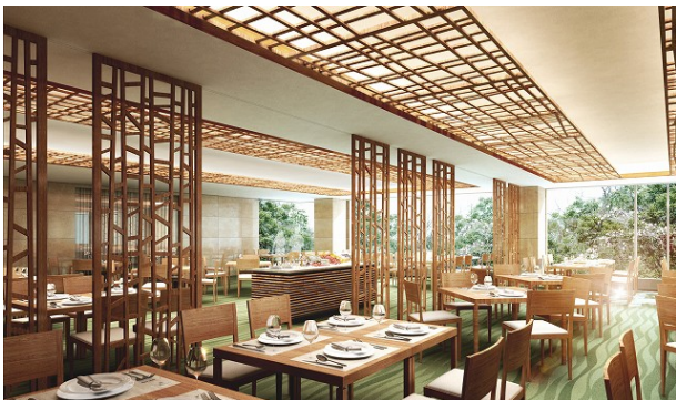
バイキングレストランイメージ

『蓼科グランドホテル滝の湯』は、創業88年の歴史を持つ老舗旅館であり、天皇陛下が皇太子時代に4度ご宿泊された由緒ある温泉旅館です。今回のリニューアルでは、①森のぬくもりや香りを感じる、ゆとりのあるロビーへの改装、②滝を望む庭園大浴場の改装、③庭園大浴場内に露天風呂の新設、④お食事のメイン会場の、地元食材を使ったバイキングレストランへの改装、⑤スイートタイプの客室の増設を行います。