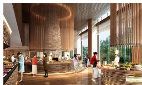
バイキングレストランイメージ

また、サラダアイランドには、‘体に優しいメニュー’をコンセプトに、‘野菜王国’といわれ、全国の料理人から高い評価を得ている長野県南佐久郡川上村産の高原野菜を中心に 15 種類の野菜と 12 種類のドレッシングをご用意し、さらに、信州オリジナル食材の「信州サーモン」や「信州地鶏」を取り入れた料理など、地元の食材にこだわった約 70 種類のメニューをご提供します。また、オープンキッチン形式を採用し、シェフの料理を間近で見たり、会話したりしながら、出来たての料理を楽しんでいただけるライブパフォーマンスコーナーや、ブッフェテーブルを低くしたキッズメニューコーナーを設けるなど、あらゆるお客さまにお食事を楽しんで