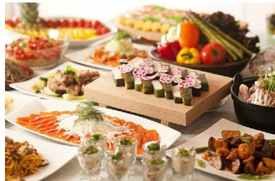
バイキングメニューイメージ

今回のリニューアルオープンの目玉であるバイキングレストランでは、象徴的なタワー型の石釜で焼き上げる、出来たてあつあつのピザやパンをご提供するほか、‘野菜王国’といわれ、全国の料理人から高い評価を得ている長野県南佐久郡川上村産の高原野菜や、信州オリジナル食材である「信州地鶏」や「信州サーモン」など、地元の特産品を生かした70種類以上のメニューをオープンキッチン形式でご提供します。信州の豊かな大地が育んだ、自然の“恵み”を存分にご堪能下さい。