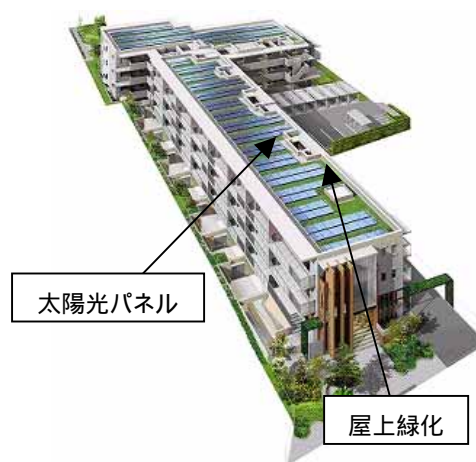
【「サンクタス武蔵野関前」外観イメージ】

オリックス不動産は、「ECORIX2012」に基づいて今後も環境に配慮した住まいの提供を推進していきます。