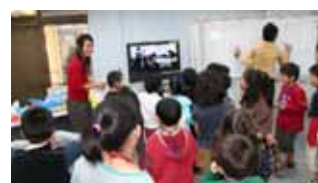
【前回開催の様子】 TV 会議を体験する子どもたち