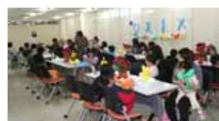
【前回開催の懇親会の様子】