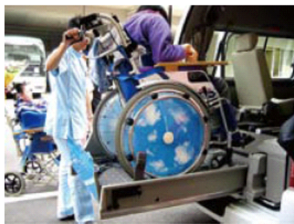
納車されたばかりの福祉車両に試乗

全国の肢体不自由児・者施設などに福祉車両を寄贈。 2006年度から開始し、これまで23施設に寄贈しました。