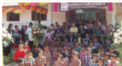
オリックス教育センター 上:バンホウセーラーオ校 下:バンナカエ校