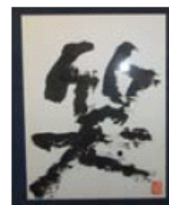
2009年度「オリックス賞」受賞作品