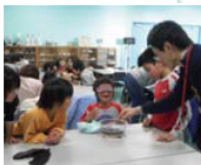
生き物と触れ合う体験学習

神奈川県の子童養護施設の子どもたちを新江ノ島水族館の見学と体験プログラムに招待し、社員ボランティアと交流しています。