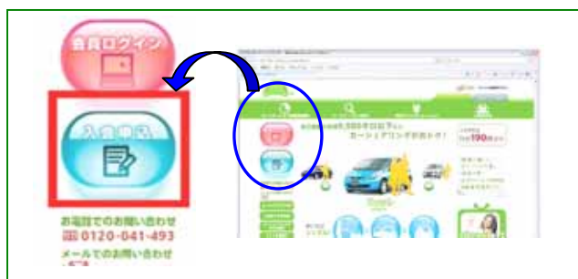
トップページから WEB 入会申込ページへ