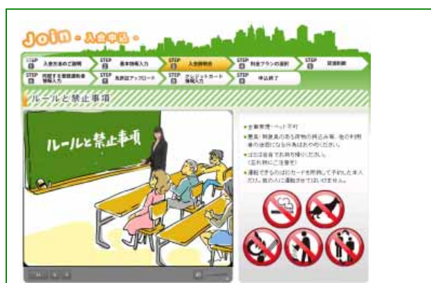
イラスト付きの動画を用いて分かりやすくご説明します