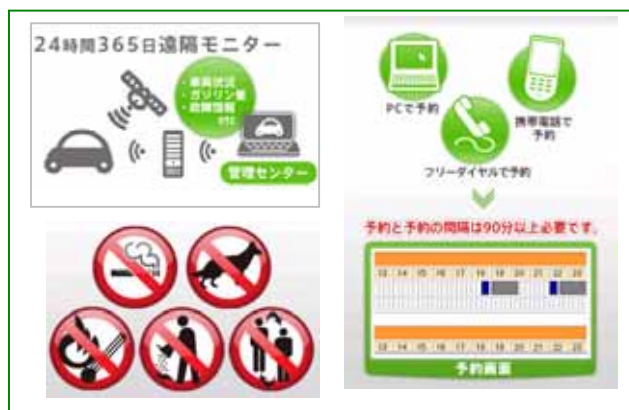
入会説明は WEB 内の動画にて説明