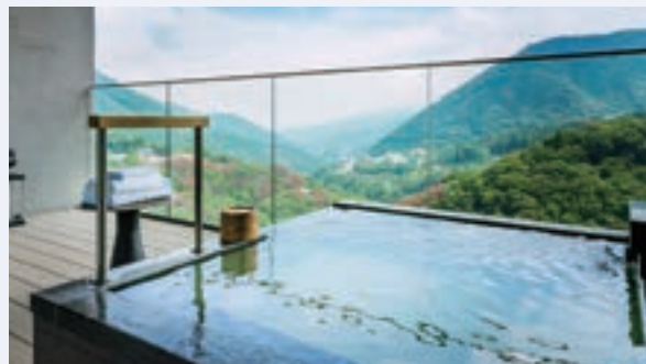
箱根・強羅 佳ら久