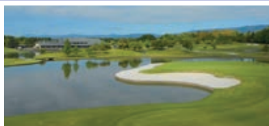
富士OGMエクセレントクラブ伊勢大鷲コース