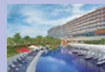
ヒルトン沖縄北谷リゾート

※2018年9月に「宇奈月 杉乃井ホテル」から名称を変更しました。 また、2019年春(予定)まで、リニューアル工事実施に伴い休館しています。