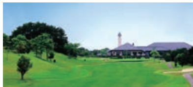
六甲カントリー倶楽部