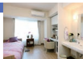
お一人さまタイプ/モデルルーム