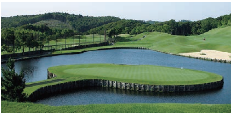
きみさらずゴルフリンクス