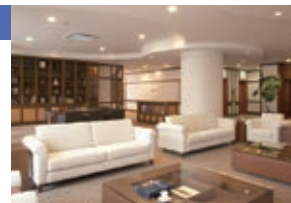
「プラテシア」ラウンジ