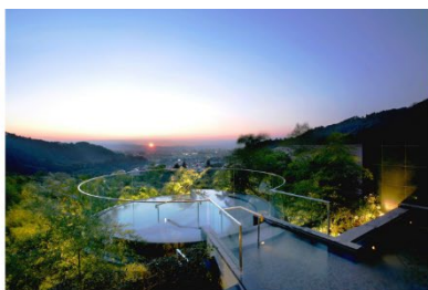
会津・東山温泉 御宿 東鳳