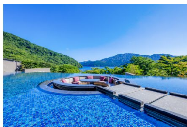
箱根・芦ノ湖 はなをり