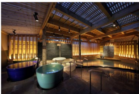
函館・湯の川温泉 ホテル万惣 （北海道函館市）

※以下のオリックスグループが運営する4施設から1施設をご選択ください。現地までの往復交通費は、受賞者さまのご負担となります。