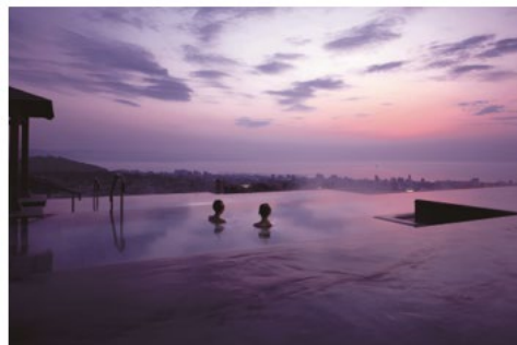
別府温泉 杉乃井ホテル (大分県別府市)