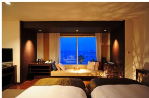
ホテル ミクラス (静岡県熱海市)