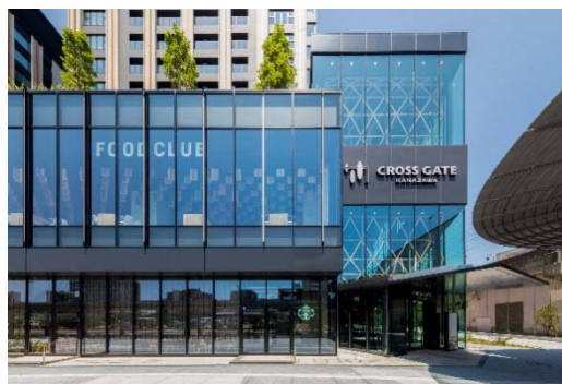
商業部分エントランス