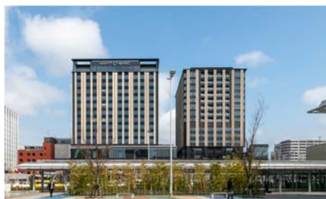
「クロスゲート金沢」外観写真（昼）

当施設全体で「LEED ND（近隣開発）」、施設の中核である2ホテルで「LEED NC（現LEED BD+C、建築設計および建設）」のシルバー認証 ※1 を得ました。なお、フルサービスホテルでLEED認証を取得するのは日本初となります。