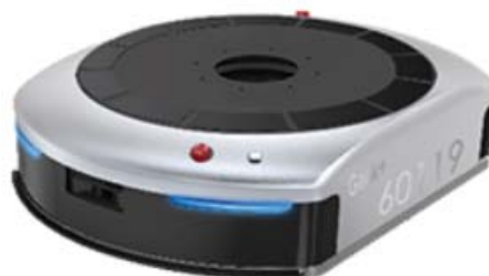
ピッキングロボット“EVE”（EVE800）

仕入れ商品の陳列やピッキングは、これまで作業員による手作業に拠っていたため身体的な負荷と作業効率の低さが課題でしたが、商品が並ぶ専用棚の下部に潜り込み、棚自体が作業員の待つワーキングステーションまで自動で移動する機能を持つピッキングロボット“EVE”の導入により、作業員の負担軽減が見込めます。さらに、省エネ設計により、30分の充電で10時間の稼働が可能で、手作業に比べて約3倍程度、作業効率の向上が図れます*。