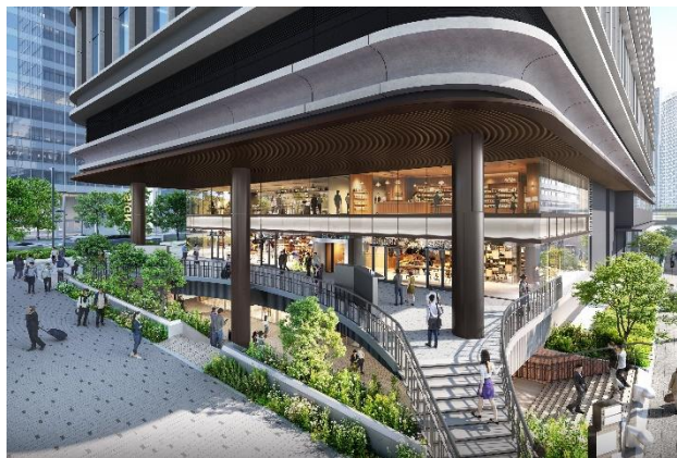
サンクンガーデンに面した商業施設（イメージ）

フラワーロード沿道に面した地上1・2階、さんちかや地下鉄海岸線三宮・花時計前駅とつながる地下1階を含む3フロアに、地域の魅力を発信するなど個性あるさまざまな飲食・物販・サービス店舗を配置するとともに、地上と地下をつなげる開放的なサンクンガーデンを整備することで、神戸のまちの回遊促進および賑わい創出を図ります。