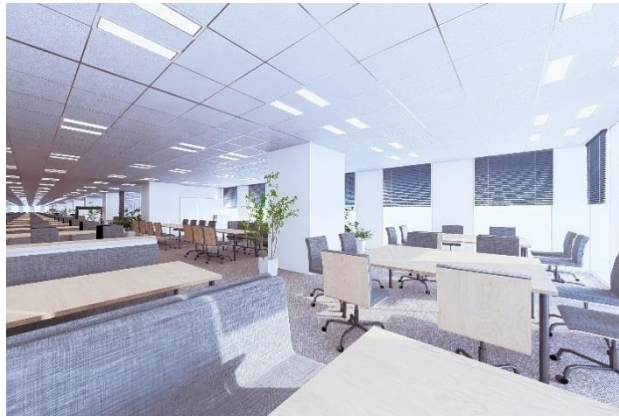
オープンな執務空間（イメージ）

コミュニケーションの活性化や時代の変化への柔軟な対応のため、間仕切りのないオープンな執務空間を確保するとともに、遮音性の高い会議室や上下階の交流を円滑にする内部階段の設置などにより、職員が働きやすく、生産性の高いオフィス環境を整備します。また、環境性能として、市庁舎部分において「ZEB Oriented」相当を達成し、BELS 認証（建物の省エネルギー性能を表示する第三者認証制度）を取得しています。