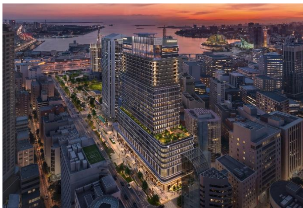
夜間時の外観（イメージ）

神戸の海と山を結び、周辺の景観と調和する神戸らしい上質な外観をイメージし、ホテルなどが入る高層部はガラスボックスを頂部に取り入れた特徴的なデザイン、市役所機能などが入る低層部は旧2号館から継承した水平基調を意図したデザインとしています。夜は天井の高いホテルロビー空間がライトアップされ、まちの灯台のように遠くからも港町神戸を感じられるランドマークとなります。