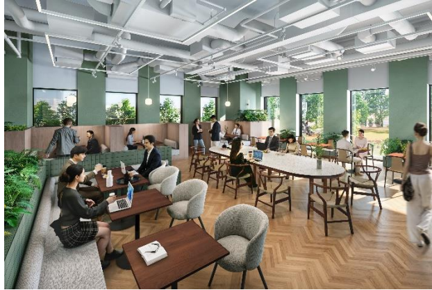
9階オフィスワーカー専用ラウンジ（イメージ）

神戸市内で最大級の1フロアあたりの貸付面積が約500坪（約1,680㎡）となるハイグレードなオフィスを整備します。1フロアの一体利用から最小約45坪（約150㎡）の分割利用まで、企業の進出ニーズに応じてフレキシブルにご利用いただけます。また、9階の屋上庭園に面して、気分転換やサードプレイスなどさまざまなシーンで利用できるオフィスワーカー専用ラウンジを整備し、オフィスワーカーのサポートと企業間交流の促進を図ります。