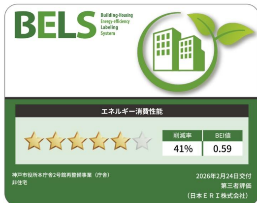
市庁舎部分：BELS 認証 ZEB-Oriented 相当

防災面では、中間階免震構造を採用することで地震時の安全性向上を図るとともに、浸水対策として電気室や機械室、防災センターなどの重要設備室を上層部に配置するなど、災害時のリスク低減を図ります。あわせて、民間エリアの一部を一時滞在施設として開放することを想定するなど、帰宅困難時対策の役割も担います。