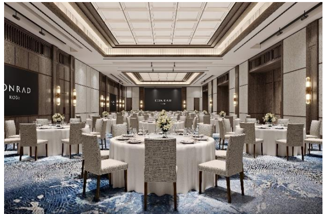
左：レセプションロビー、右：ボールルーム（イメージ）