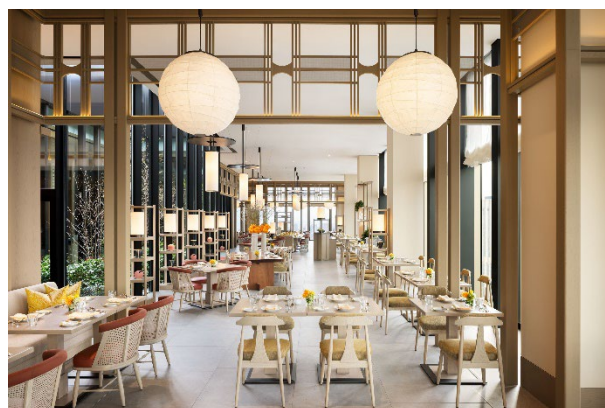
モダンフレンチブラッスリー 「ジョリー ブラッスリー(Jolie Brasserie)」

その他、各種イベントや特別なお祝いでさまざまなシーンでご利用いただける536平米のグランドボールルーム含め多様なミーティングスペースをご用意しています。また、絶景を望むチャペルも備えています。