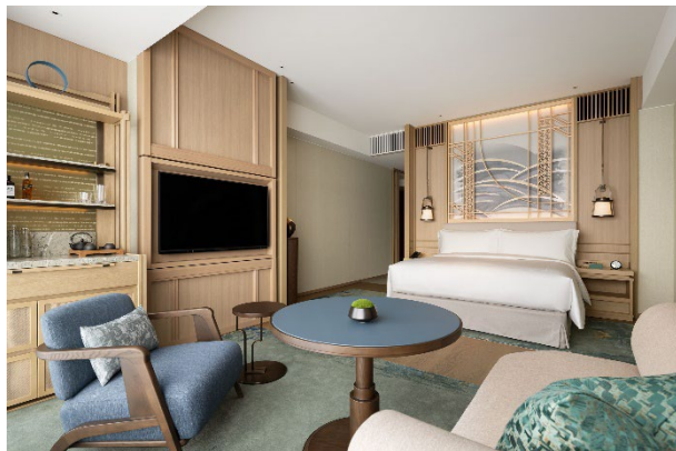
キング デラックスルーム