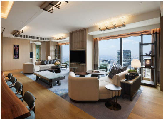
プレジデンシャルスイート

「『ウォルdorf・アストリア』ブランドの開業は、ヒルトンのアジア太平洋地域におけるラグジュアリーブランドにとって重要なマイルストーンと言えます。洗練されたラグジュアリーを象徴する『ウォルdorf・アストリア・ニューヨーク』から、時代を超え、イノベーションと直感的なサービスで築き上げてきたレガシーを継承し、この素晴らしい大阪という土地で展開できることをとても喜ばしく思います。大阪の豊かな文化遺産とブランド特有の真心のこもったエレガントなサービスを反映した、心から寛げる、そしていつまでも記憶に残る体験をお客様に提供できることを楽しみにしています」