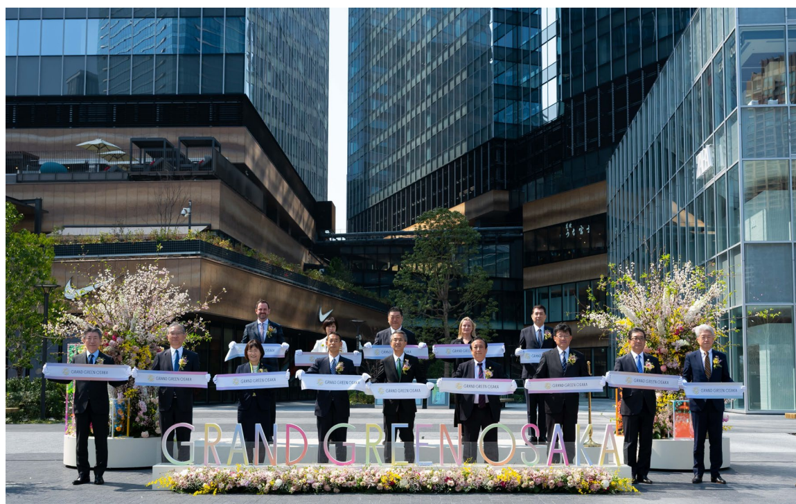
▲グラングリーン大阪 南館 オープニングセレモニーの様子

今後も、「“Osaka MIDORI LIFE”の創造」～「みどり」と「イノベーション」の融合～を計画コンセプトに、まちを訪れる方々やMIDORIパートナー *4 、各施設との連携等を通じて魅力ある価値体験を提供し、ここグラングリーン大阪から、世界に魅力を発信してまいります。