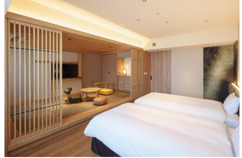
デラックス和洋室

夜空に光る星のように人々の心をときめかせる施設を目指し命名された館名にちなみ、客室のカラーコンセプトは「夜半（よわ）」「宵（よい）」「暁（あかつき）」の3種類で、夜の始まりの空から深い夜の空、夜明け前の空に浮かぶ星のひかりをイメージしています。