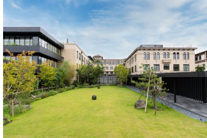
ザ・ホテル青龍 京都清水