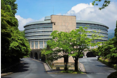
ザ・プリンス 京都宝ヶ池