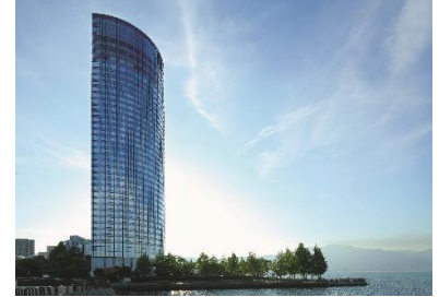
びわ湖大津プリンスホテル