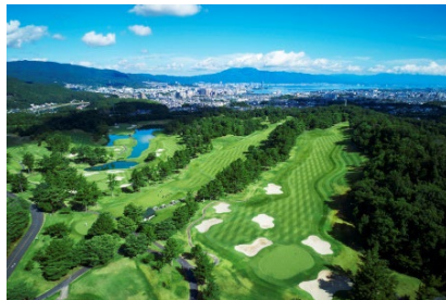
瀬田ゴルフコース