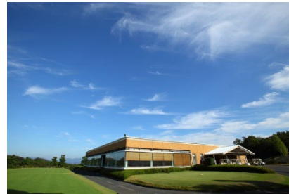
竜王ゴルフコース