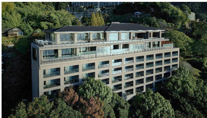
熱海・伊豆山 佳ら久 外観