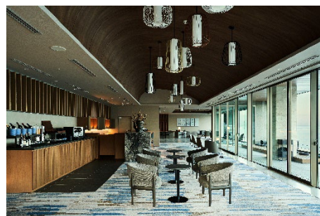
ゲストラウンジ「間 (AWAI)」

「刻」は多くの文化人に別荘地として親しまれた熱海の歴史を感じられる設えとしました。熱海の山々を感じるテラスで、思い思いにおくつろぎいただけます。