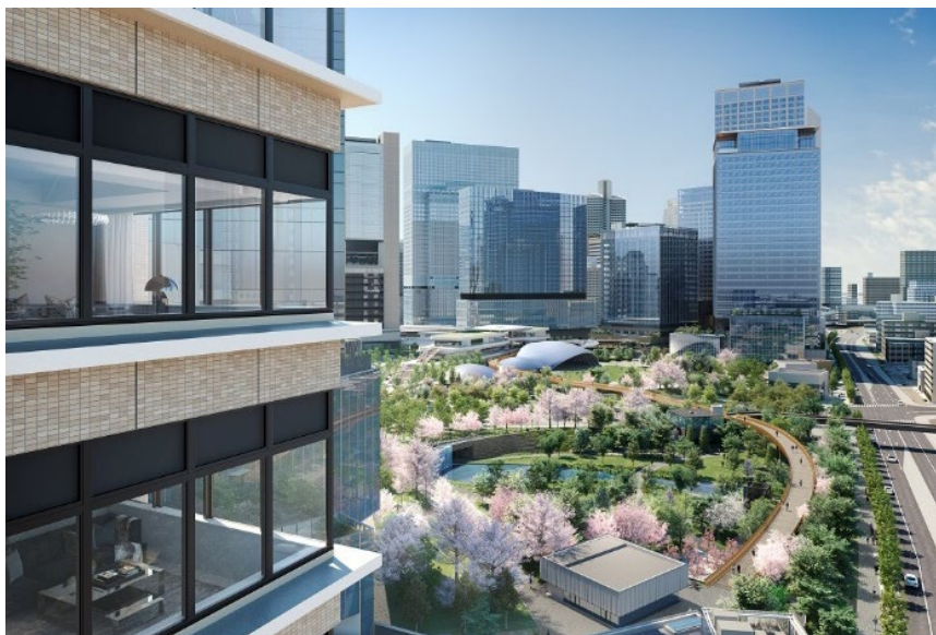
「うめきた公園」が眼前に広がるロケーション イメージ

都市公園「うめきた公園」を中心に配したグラングリーン大阪は、西日本最大のターミナル・JR大阪駅のすぐそばに誕生する、合わせて約9.1haの大規模複合開発であり「みどり」と融合した生命力あふれる都市空間で、オフィスや商業施設などさまざまな機能も有しています。当レジデンスは、その「北街区」に位置しており、開発計画の最大の特長である「うめきた公園」が眼前に広がるロケーションとなっています。