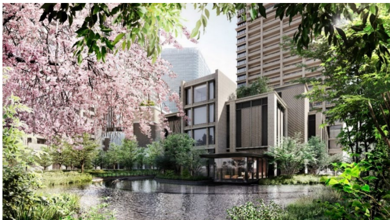
自然と共生する緑と水の外構 イメージ

当レジデンスに住まう方々に対し、安全・安心や快適性、そして環境性能を追求した高い付加価値を提供することにより、一層の質の高い暮らしを実現します。