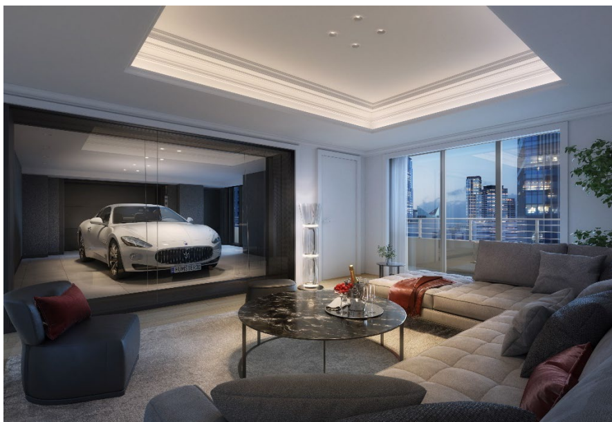
カーギャラリー付き住戸 イメージ