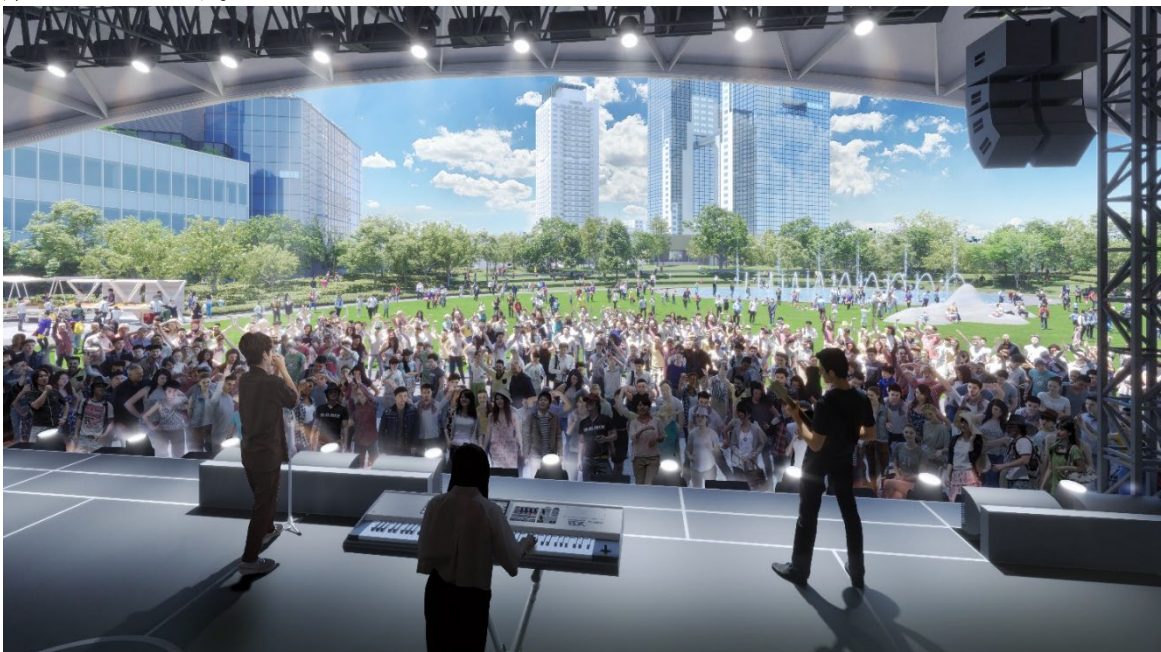
多様なイベントに対応し、来街者が非日常体験を味わえる「大屋根イベントスペース」

今後、本公園の大屋根イベントスペースや芝生広場を中心に展開する魅力的なイベントコンテンツの企画・誘致を本格的に開始します。また、本プロジェクトのサステナブル/SDGs や共創等の価値観を踏まえ、まちの魅力と企業価値を共に成長させる制度「MIDORI パートナー制度」を創設し、参画企業を積極的に募集してまいります。