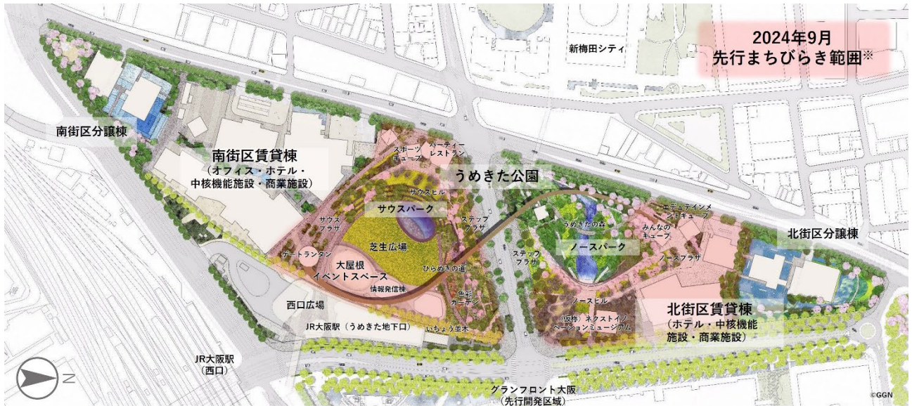
グラングリーン大阪 開業予定範囲図 ※4,5

2024年9月に、グラングリーン大阪全体のうち、うめきた公園（サウスパークの全面・ノースパークの一部）及び北街区賃貸棟が先行開業します。なお、南街区賃貸棟は2025年春頃、うめきた公園後行工区（ノースパークの一部）は、2027年春頃に開業予定です。