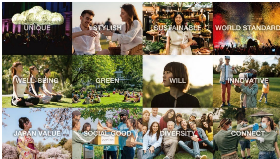
イベントで大切にしたい12の要素