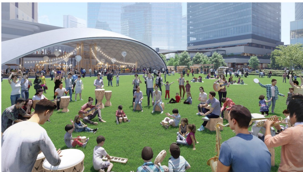
青々とした天然芝を舞台に、来街者の日常を彩るプレイスメイキングを展開