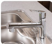
水栓（浄水器含む） ●濁った水が出る ●水の出が悪い