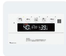
給湯器リモコン ●作動しない ●温度が上がらない