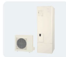
エコキュート ●お湯が出ない ●追い焚きができない