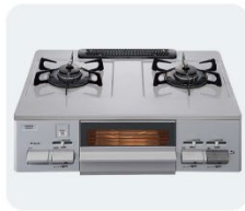
ガスコンロ ●魚焼きグリルが点火しない ●コンロの火が着かない