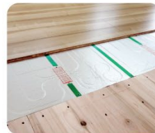
床暖房 ●部分的に温まらない ●温度調節ができない