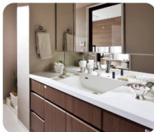
洗面化粧台 ●水の出が悪い ●照明が点かない