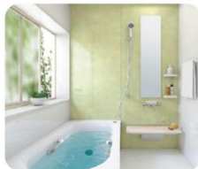
ユニットバス ●照明が点かない ●排水口が閉まらない