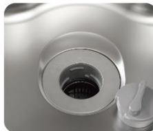
ディスポーザー ●電源が入らない ●異音がる