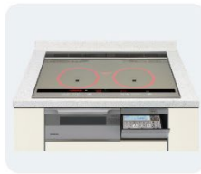
IHクッキングヒーター ●温度が上がらない ●スイッチが反応しない