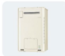
ガス給湯器 ●お湯が出ない ●追い焚きができない