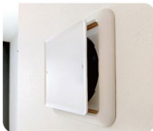
24時間換気システム ●作動しない ●換気ができない