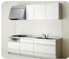
システムキッチン ●収納扉が開かない ●引き出しが開かない