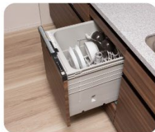
ビルトイン食器洗い乾燥機 ●スイッチが反応しない ●食器が洗えない