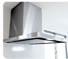
レンジフード ●吸い込みが悪い ●異音がる