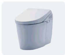
温水洗浄トイレ／機能付便座 ●ノズルが出ない ●水圧が弱くなった