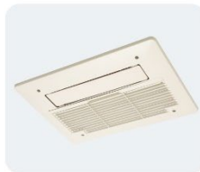
浴室換気乾燥機 ●異音がる ●換気ができない