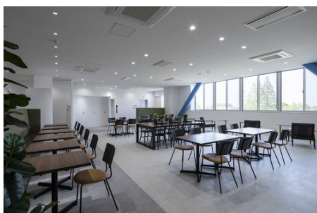
2 階 北ラウンジ

また、3 階倉庫内は空調設備を実装しました。入居テナント企業自身で空調設備を新たに導入する必要がなく、最上階でも働きやすい快適な環境を整えています。