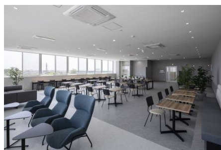
3 階 南ラウンジ