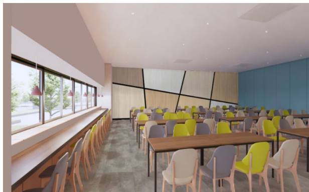
カフェラウンジ（イメージ）

1階には、昼食や休憩などに利用できる約100席の「カフェラウンジ」を用意する予定です。カウンター席なども設け、昼食や休憩などさまざまなシーンで活用いただけるスペースとして、入居テナント企業の従業員が快適に働くことができる職場環境を用意します。