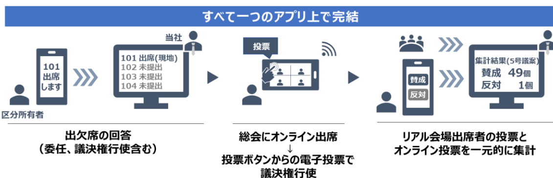
「マンション WEB 会議」(イメージ)

「マンション WEB 会議」では、オンライン上で管理組合の総会を視聴できるほか、議決権の行使も行うことができるため、総会に関する一連の手続きをオンラインで完結できます。これまで総会における区分所有者の意思表示は、①書面による委任、②書面による議決権行使、③当日出席による賛否表明 の 3 パターンのみでしたが、2021 年 6 月に「マンション標準管理規約」が改正され*2、IT を活用した総会出席、議決権の行使が明確となり、本機能の提供に至りました。本サービスの出欠席・議決権行使機能、総会出席機能、電子投票機能により、オンラインでの意思表示ができます。（理事会でも同様に利用可能）