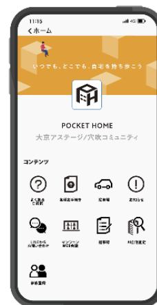
「POCKET HOME」 使用画面（イメージ）

当社は、2020年7月に管理組合の総会をウェブ上で視聴できる「WEB総会サービス」を試験導入 ※1 しました。2021年6月には「マンション標準管理規約」が改正 ※2 され、ITを活用した総会出席、議決権の行使が可能となり、本サービスへ新たに投票機能を搭載しました。総会への出欠連絡、出席、投票（現地会場出席者の投票も含む）までを一つのアプリ上で完結し、一元的に集計できる業界初 ※3 のサービス「マンションの総会支援システム」として、ビジネス関連発明の特許出願中です。