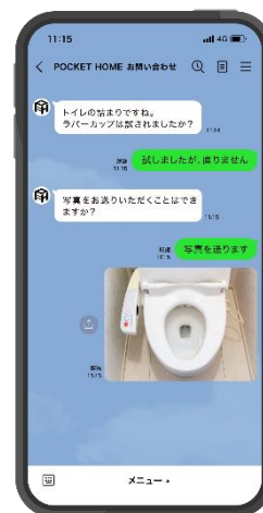
「LINE からお問い合わせ」使用画面 (イメージ)

「企業とのチャット相談をよく使うようになった」「画像を使ってトラブルを説明できるのは便利」「緊急度の高さによってチャット・電話を使い分けたい」という声から生まれたコンテンツです。居住者が専有部内の設備トラブルを LINE のトークで送ると、チャットボットによる自動回答で質問にお答えします。自動回答で解決しない場合には、修繕専門スタッフがチャットや電話で個別対応を行い、修理業者の手配や日程調整まで完結させることが可能です。（ご利用には LINE 公式アカウントの友だち追加が必要です）