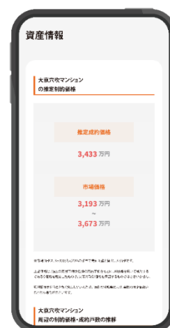
「AI 自宅査定」 使用画面（イメージ）