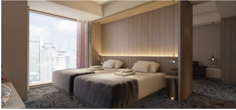
▲客室（完成予想イメージ）

全 482 室の客室は、2 名までのお客さまをおもてなしする構成になっており、自然体でゆったりとした時間を過ごせる“大人が楽しめる空間”を創出しています。