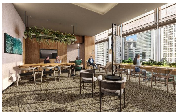
▲宿泊者専用ラウンジ（完成予想イメージ）