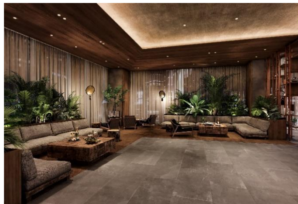
▲ホテルロビー（完成予想イメージ）