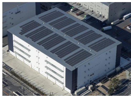
屋根に設置した太陽光発電設備

本物件は、首都高速湾岸線「千鳥町インターチェンジ（IC）」から約3.6km、東京外郭環状道路（三郷南IC～高谷JCT）の開通により、都内主要エリアへ良好なアクセスが整うエリアに位置します。また、20、30km圏内に東京港や羽田空港があり、都心への配送だけでなく、船便や航空便を利用した広域配送にも適しています。JR京葉線「市川塩浜」駅から徒歩約12分と、入居テナント企業の雇用確保の面においても優位性が高い立地です。