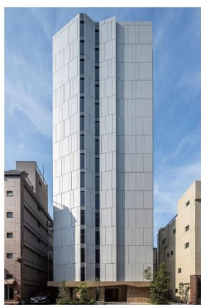
ライオンズフォーシア浅草橋 (2022年3月竣工)

「ライオンズフォーシア」は、2007年より展開する、分譲マンションの開発で培ったノウハウを活用した大京の賃貸マンションブランドです。これまで東京・神奈川・大阪・広島で24棟の開発実績（本物件含む）があり、各地の都心で働く20代～40代のシングルや共働きのご夫婦、小さなお子さまのいるご家族を中心にご入居いただいています。外観デザインはホテルや商業施設のトレンドを取り入れながら一棟一棟のデザインにこだわり、間取りは都心の賃貸居住者の生活ニーズに対応した多彩なプランを企画しています。