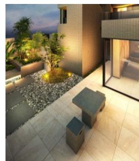
プライベートガーデン（イメージ）

1階には、開放的な大きな窓で外とホール内の一体感にこだわったラウンジや、四季折々の植栽が彩るプライベートガーデンを備えました。入居者さまにくつろぎや安らぎを感じていただける優雅で上質な共用空間をご提供します。