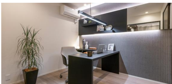
書斎（モデルルーム）