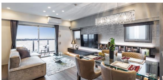
リビングダイニング（モデルルーム）

南西と南東向きの配棟で、間取りは、1LDK～3LDK（55.32㎡～82.55㎡）の6タイプです。全6タイプにて、基本プランにくわえ二つのメニュープランも用意し、単身者からDINKS、ファミリーなど、多彩なニーズにお応えします。クローゼットをワークスペースへ変更したプランや、二つの部屋から使用できるウォークスルークローゼットを追加したプランなど、お客さまのライフスタイルに合わせてさまざまなご提案が可能です。