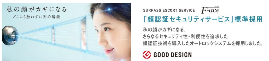
サーパスエスコートサービス F·ace (イメージ)

顔認証技術を導入したセキュリティサービス「サーパスエスコートサービス F·ace」を標準採用しています。鍵やカードを使うことなく、顔認証にて共用入口や 1 階エレベーターのセキュリティが解除でき自宅階までのエレベーター自動運転を可能にします。また、宅配ボックスも顔認証で解除可能です。最新のテクノロジーによる安心・便利なライフスタイルをお届けします。