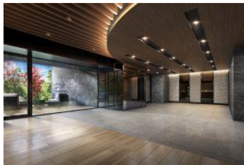
エントランスラウンジ（イメージ）

エントランスラウンジは、プライベートガーデンを併設し、木目調のルーバーと間接照明が美しい、安らぎと落ち着きの時間をお過ごしいただける空間です。