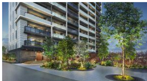
外観とエントランスアプローチ（イメージ）

外観は、地域の伝統的織物である「尾州織」をデザインコードに、たて糸とよこ糸の交差がもたらす特長を表現しています。また、20m あるエントランスへのアプローチには、一宮市のシンボルツリーである「ハナミズキ」を植え、地域の方も憩えるオープンガーデンを有します。オープンガーデンには、災害時に加熱調理が可能な「かまどスツール」を備えます。