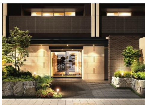
エントランス（イメージ）

本物件は、大分市役所や大分城址公園などが建ち並ぶ昭和通り沿いに位置し、利便性の高い施設が揃う JR「大分」駅までバスで9分の立地です。