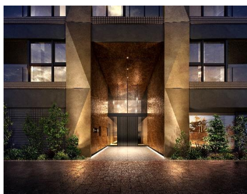
エントランスアプローチ（イメージ）

本物件は、東京メトロ丸ノ内線・有楽町線・副都心線「池袋」駅徒歩7分、JR山手線「池袋」駅徒歩10分と、全8路線が集まるビッグターミナル「池袋」駅の徒歩圏内に位置します。「東武百貨店 池袋店」や駅直結の「Esola 池袋」などの大型商業施設がそろう駅周辺エリアは、「特定都市再生緊急整備地域 ※1 」として再開発が進み、利便性はもちろん、公園、劇場、カフェなど、文化芸術・地域のにぎわい・情報発信拠点として整備されています。