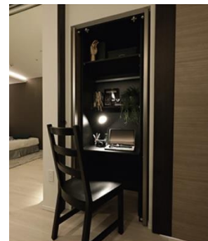
ワークフィットボックス (モデルルーム)

間取りは、1LDK から 3LDK (43.40 m 2 ~72.37 m 2 ) の全 14 タイプからお選びいただけます。全タイプサッシ高は、約 2.2 メートル (天井高約 2.5 メートル) と、開放感を感じることができる住空間です。リビング・ダイニング以外の一部の洋室にも床暖房を設置したお部屋や、天板に天然御影石を使用したキッチン・洗面化粧台、クローゼットスペースを活用した機能的でコンパクトなワークスペース「ワークフィットボックス」を設置したお部屋など、高規格な設備仕様をそろえます。