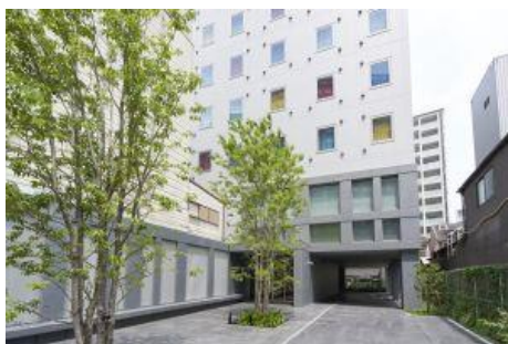
アプローチと外観

従来のフロントレセプションに加え、お客さまご自身でチェックインいただける自動チェックイン機も導入しています。