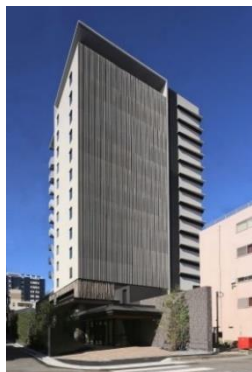
クロスライフ博多天神 外観

株式会社大京（本社：東京都渋谷区、社長：深谷 敏成）は、福岡市で開発したホテル「クロスライフ博多天神（286室）」および「クロスライフ博多柳橋（242室）」を2022年10月1日（土）に開業しますのでお知らせします。当ホテルの運営は、グループのオリックス・ホテルマネジメント株式会社（本社：東京都港区、取締役社長：似内 隆晃）が行います。