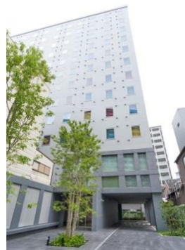
クロスライフ博多柳橋 外観

両ホテルは、「自分らしくいられるお気に入りの場所」を提案する「ORIX HOTELS & RESORTS」のカジュアル・ライフスタイルブランド「CROSS Life（クロスライフ）」初のホテルとして誕生します。「クロスライフ」ブランドは、ホテルを拠点とし、その地域でしかできない体験や、自分らしく「life（ライフ）」を楽しみ、充実した時間を過ごせる空間やサービスを提供する、地域とともにあるサードプレイスを目指します。