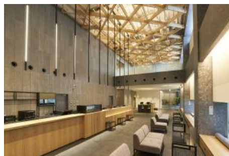
大川組子をモチーフとした天井