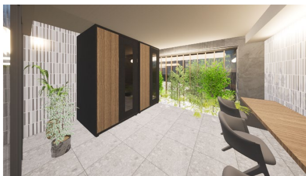
テレワークラウンジ（イメージ）

1階エントランス横には、約 19㎡のテレワークラウンジを設けます。Wi-Fi やコンセントが完備された落ち着いた空間です。デスクエリアに加え、2つの個室ブースもご用意しており、周囲の視線や音を遮ることができるため、集中したい仕事や学習など、快適にご利用いただけます。