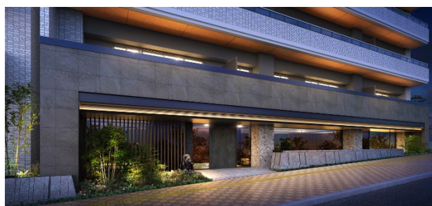
エントランス（イメージ）

本物件は、地元の方に親しまれてきた旧北海道テレビ放送（HTB）本社跡地に建ちます。札幌市営地下鉄南北線「南平岸」駅徒歩 5 分、「大通」駅まで直通 9 分、「さっぽろ」駅まで直通 11 分など都心への良好なアクセスを有します。標高 64.7 メートル*1 から札幌の街並みを望める希少な立地で、隣接する「平岸高台公園」をはじめとする豊かな緑に囲まれた開放感と、スーパーや飲食店などが徒歩圏にそろう都心部ならではの高い利便性を備えています。