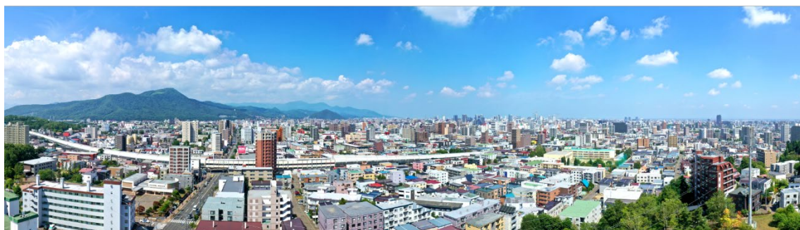
15階南西側眺望（イメージ）

間取りは、2LDK、3LDK、4LDK（専有面積 53.01 m 2 ～84.71 m 2 ）の全 10 タイプ、13 のバリエーションからお選びいただけます。西に面する高層棟と南に面する低層棟の二棟構成となっており、採光にも優れます。