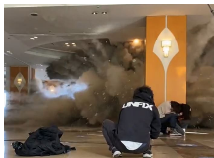
「ロビーで爆破シーン撮影の様子」

別府短編映画制作プロジェクトの第二弾作。『長髪大怪獣ゲハラ』で商業監督デビューし、ウルトラマンシリーズで三作品でメイン監督を務めた田口 清隆氏が監督を務め、主演は『ウルトラマンオーブ』『劇場版ウルトラマンジード』にてオーブの宿敵ジャグラスジャグラ役を演じ、人気を博した俳優の青柳 尊哉氏が務めます。映画制作プロジェクトが掲げる<30分以内の短編><撮影はオール別府ロケ><別府市民と力を合わせて作品作り>をベース