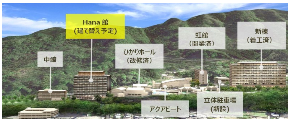
大規模リニューアル完了後のイメージ

2021年12月1日に閉館した「Hana館」の建て替えのほか、計3棟の客室棟を新築し、2025年に全面リニューアル工事完了を目指しています。