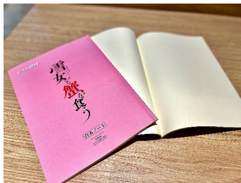
タイアッププラン 特製台本ノート（イメージ）

当社は、運営する旅館・ホテル計15施設（第三者に運営を委託している施設を含む）で「地域共創プロジェクト」※を推進し、その取り組みの一環として、地域全体や当社の運営施設へのロケ誘致を図る「オリックスロケーションサービス」を展開しています。2007年以降、オリックスグループの運営施設などでロケ誘致を推進し、2021年5月からは、周辺の観光地など、対象範囲を拡大するとともに、各自治体と協業しながら積極的なロケ地の受け入れを発信してきました。