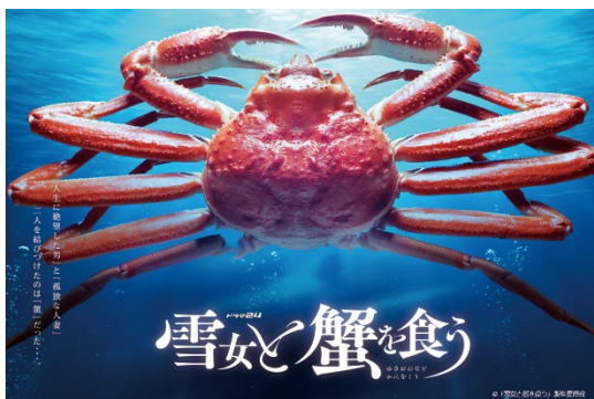
「雪女と蟹を食う」（イメージ）

オリックス・ホテルマネジメント株式会社（本社：東京都港区、社長：似内 隆晃）は、テレビ東京 ドラマ 24「雪女と蟹を食う」のロケ地として、「ORIX HOTELS & RESORTS」の3施設「会津・東山温泉 御宿 東鳳」（福島県会津若松市）、「函館・湯の川温泉 ホテル万惣」（北海道函館市）、「クロスホテル札幌」（北海道札幌市）に誘致しましたのでお知らせします。あわせて、誘致を記念して、ドラマとタイアップした宿泊プランを企画し、2022年8月6日（土）より予約受付を開始します。