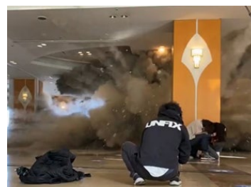
(左) 「踊る大捜査線 THE FINAL ～新たなる希望～」 で捜査会議室となるクロス・ウェーブ府中 (撮影 2012 年) (右) 別府短編映画「大怪獣ブゴン」 別府温泉 杉乃井ホテル Hana 館ロビーで特撮シーンの撮影 (撮影 2021 年)