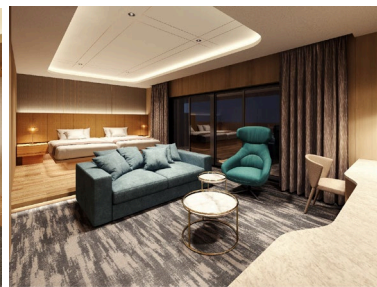
ラグジュアリーキャビン (イメージ)