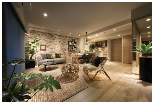
リビングダイニング (モデルルーム)