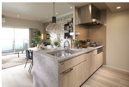
キッチン (モデルルーム)