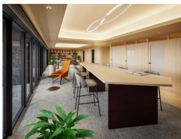
オーナーズライブラリー (イメージ)