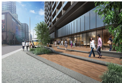
シティデッキ (イメージ)