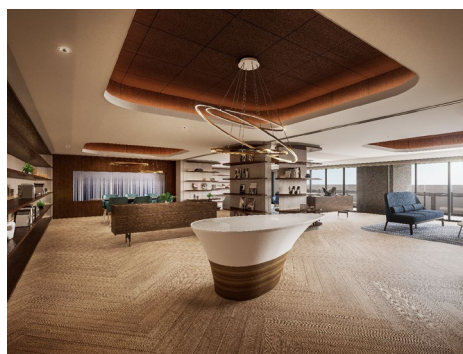
オーナーズラウンジ（イメージ）

本物件は、2022年3月1日（火）に着工 ※1 し、当社の分譲マンション、サーパスシリーズにおいて過去最大規模の開発です。JR 上越新幹線・信越本線・白新線・越後線が乗り入れる「新潟」駅より徒歩10分、数多くの大型商業施設が集まる新潟の中心エリア「万代シティ」内に位置します。