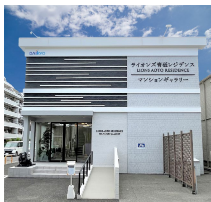
大京のマンションギャラリー（東京都葛飾区）

大京は、2018年に兵庫県芦屋市で、日本初の「Nearly ZEH-M」仕様マンションの販売を行うなど、両社はこれまで計 26 件の ZEH マンションを手掛け環境に配慮したマンション開発に積極的に取り組んでいます。今後は、新築マンション事業のプロセスや企業経営においても脱炭素を推進し、地球環境に優しい住まいづくりを加速します。今後も快適な暮らしと低炭素社会の実現を目指してまいります。