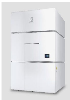
クライオ電子顕微鏡

クライオ電子顕微鏡は、タンパク質などを瞬間的に凍結させることで構造を保ったまま観察できる装置です。研究第一を理念に掲げる東北大学は、2024年に運用開始を目指す次世代放射光施設 ※2 との相補利用により、ナノからマイクロまでのあらゆる物質を可視化できる環境を整えます。主な観察対象とするタンパク質だけではなく、有機材料、有機・無機ハイブリッド材料 ※3 など幅広い分野での研究が可能になることから、ライフサイエンス分野での疾患発症のメカニズム解明や創薬研究などの他、グリーンイノベーション分野での省エネルギーにつながる新素材の開発などへの活用が期待されます。また、当該システムを他大学および企業と共用することで、幅広い分野での革新的な研究開発に貢献します。