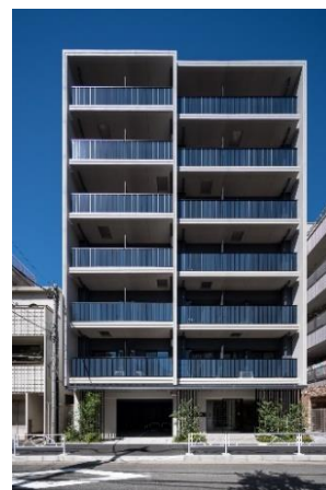
ライオンズフォーシア押上 (2021年8月竣工)