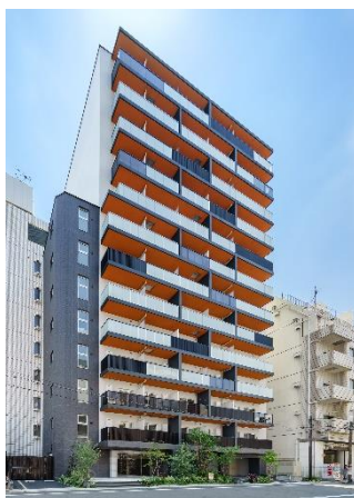
ライオンズフォーシア両国 (2021年7月竣工)