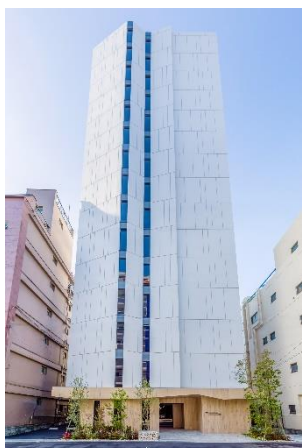
ライオンズフォーシア浅草橋 (2022年3月竣工)

「ライオンズフォーシア」は、2007年より展開する、分譲マンションの開発で培ったノウハウを活用した大京の賃貸マンションブランドです。これまで東京・神奈川・大阪・広島で22棟の開発実績（本物件含む）があり、各地の都心で働く20代～40代のシングルや共働きのご夫婦、小さなお子さまのいるご家族を中心にご入居いただいています。外観デザインはホテルや商業施設のトレンドを取り入れながら一棟一棟のデザインにこだわり、間取りは都心の賃貸居住者の生活ニーズに対応した多彩なプランを企画しています。