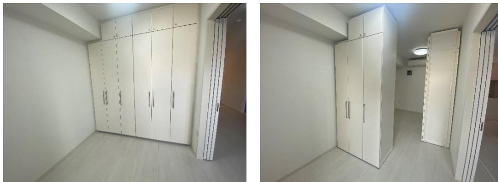
可動式収納棚の移動イメージ

2DKの一部(10戸)には、可動式の天井までの高さがある収納棚を二つ設けました。ストッパーを外すことで、棚を自由に移動させることができます。居室内の間仕切りとしても設置できるほか、二つの棚を分けて設置することで一続きの居室でも利用できます。