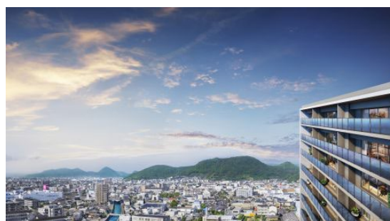
高松市内の眺望（イメージ）

本物件は、上之町エリア内で「サーパス上之町ミッドレジデンス」※に続く2棟目となります。ことでん琴平線「三条駅」徒歩7分、中央通りや塩江街道の幹線道路に囲まれた立地で、市内・郊外へのアクセスが快適です。周辺には、「紫雲山」や特別名勝の「栗林公園」がある落ち着いた住宅街でありながら、県内最大のショッピングモール「ゆめタウン高松」やクリニックなど、生活利便施設が充実しています。