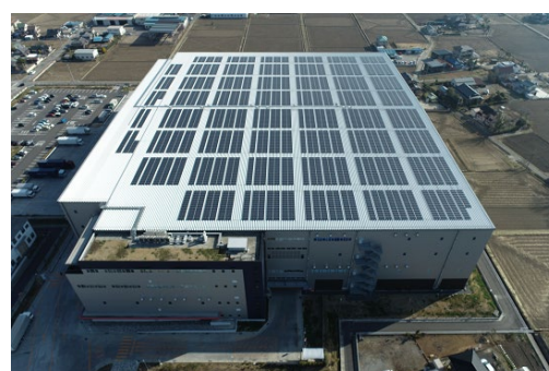
太陽光発電システムを設置

本取り組みは、松伏 LC の屋根に第三者所有モデル（以下「PPA モデル」） ※1 で 1,713kW の太陽光発電システムを設置し、発電した電力を施設内で自家消費します。夜間や天候の影響により電力が不足する場合も、オリックス株式会社より非化石証書付き（トラッキング付き）の電力を供給することで、施設内で使用する電力を 100%再生可能エネルギー由来の電力で賄います。また、希望する入居テナントに対しては、再生可能エネルギー100%の電力の環境価値を譲渡します。余剰電力は、FIT や FIP 制度 ※2 を用いて売電します。