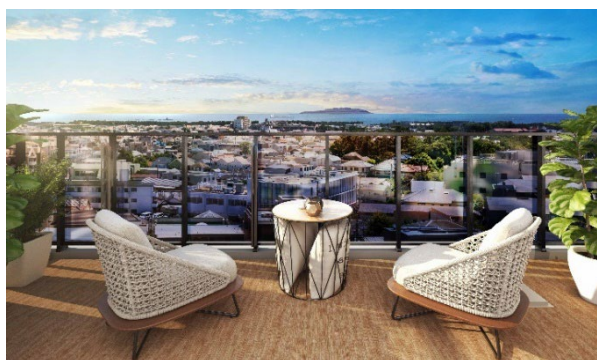
11階 (Dタイプ) のバルコニーからの眺望 (イメージ)