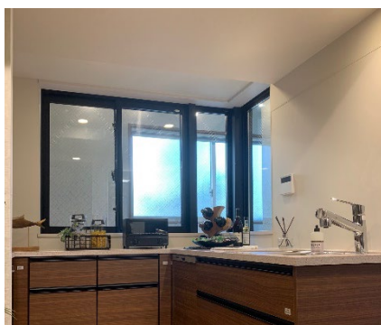
ピュアライトスタイルキッチン (インフォメーションサロン)

専有面積は 35.33 m 2 ～72.52 m 2 で、1LDK～3LDK の全 5 タイプ、明るく風通しの良いお部屋を多くご用意しています。上層階・南向きの住戸には、相模湾を望めるオーシャンビュー住戸もあり、立地を生かした設計です。そのほか、二つの窓に面し、二方向からの採光を確保したコの字型のキッチン「ピュアライトスタイルキッチン」を採用したプランや、角に柱の出ないアウトポール設計で、効率的な部屋使用が可能なプランなど、こだわりのプランをご用意しています。