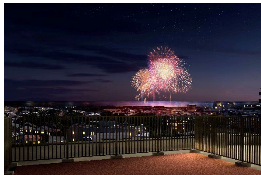
屋上デッキからの眺望（イメージ）

共用施設は、1階にサーフボード置き場、専用の洗い場などを備え、気軽にレジャーをお楽しみいただけます。屋上には約55㎡の広々とした屋上テラスを有し、夏には「サザンビーチちがさき花火大会」の花火なども見ることができます。また、1階エントランスホールにはWi-Fi利用可能なラウンジを備え、テレワークにも最適です。