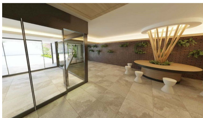
エントランス・ラウンジ（イメージ）

本物件は、JR「茅ヶ崎」駅南口徒歩2分に位置し、JR東海道本線・上野東京ライン、湘南新宿ライン、相模線が利用可能です。「横浜」駅や「東京」駅などの都心エリアへ直通、また「熱海」「箱根」などの観光スポットへも1時間圏内と快適なアクセスを有します。物件周辺には、ショッピングセンターや公共施設、医療機関などが集結し、茅ヶ崎海岸まで徒歩16分と、高い生活利便性とともにより豊かな自然を感じることができます。