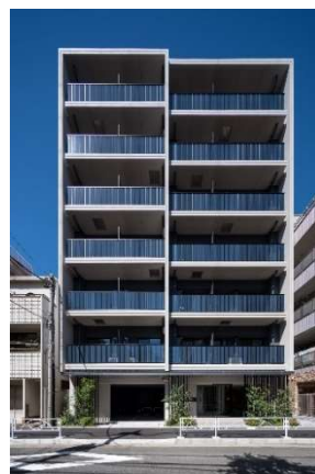
ライオンズフォーシア押上 (2021年8月竣工)