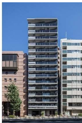
ライオンズフォーシア五反田 (2021年9月竣工)