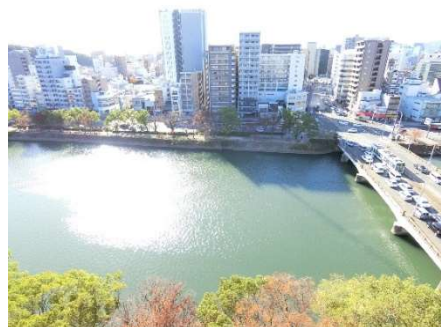
バルコニーからの眺め (12 階)

JR 山陰本線「広島」駅まで徒歩 5 分の立地で、生活利便施設が身近に揃います。駅周辺は再開発が進み、2025 年には駅ビルも開業予定で、今後の街の変化が楽しみになるエリアです。古くからオフィス・繁華街が多く集まる「八丁堀」や「紙屋町」へのアクセスにも優れた立地です。市内を流れる川沿いに面しており、部屋から開放感を感じられるとともに、市内の街並みを一望できます。