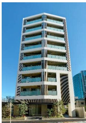
ライオンズフォーシア白金高輪 (2020年9月竣工)

「ライオンズフォーシア」は、2007年より展開する、分譲マンションの開発で培ったノウハウを活用した大京の賃貸マンションブランドです。これまで東京・神奈川・大阪・広島で20棟の開発実績（本物件含む）があり、各地の都心で働く20代～40代のシングルや共働きのご夫婦、小さなお子さまのいるご家族を中心にご入居いただいています。外観デザインはホテルや商業施設のトレンドを取り入れながら一棟一棟のデザインにこだわり、間取りは都心の賃貸居住者の生活ニーズに対応した多彩なプランを企画しています。