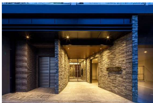
エントランスアプローチ

「ライオンズフォーシア広島西荒神」は、JR山陽本線「広島」駅より徒歩5分、広島電鉄本線「的場町」駅より徒歩3分に位置します。「広島」駅からは、JR可部線・芸備線・呉線が接続しており、新幹線利用や広島空港へのアクセスが良好です。物件徒歩5分圏内に商業施設やクリニックなどの生活利便施設が揃い、また中心街「紙屋町」や「八丁堀」まで自転車や路面電車で軽快にアクセスできます。